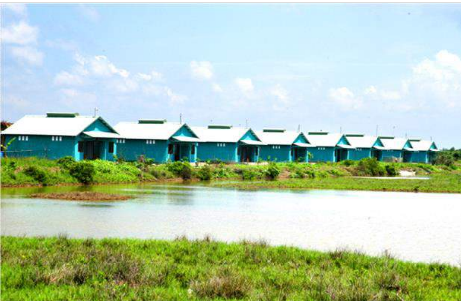
Nhà nổi (Minh Hóa, Quảng Bình)