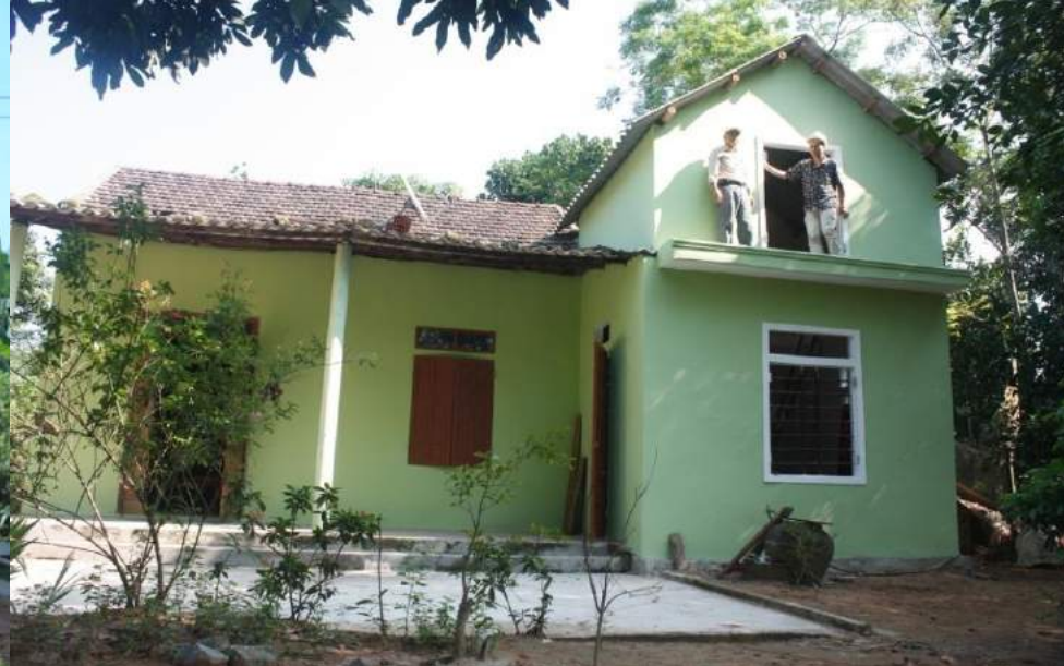
Nhà chống bão, lũ