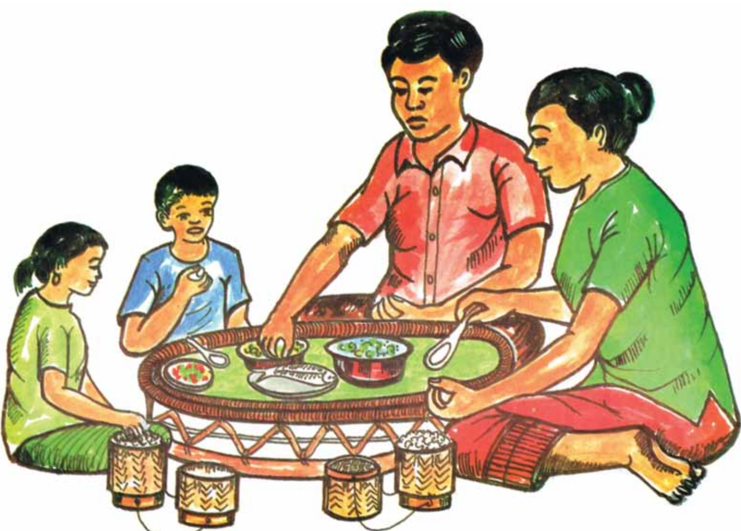
ອາຫານທີ່ປຸງແຕ່ງແລ້ວຕ້ອງພະຍາຍາມກິນ ໂລດ.