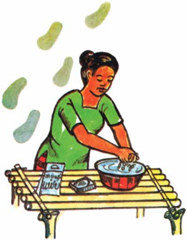
ຄວນລ້າງມືຫລັງຈາກມາແຕ່ຖ່າຍ ຫລື ກ່ອນປຸງແຕ່ງອາຫານ.