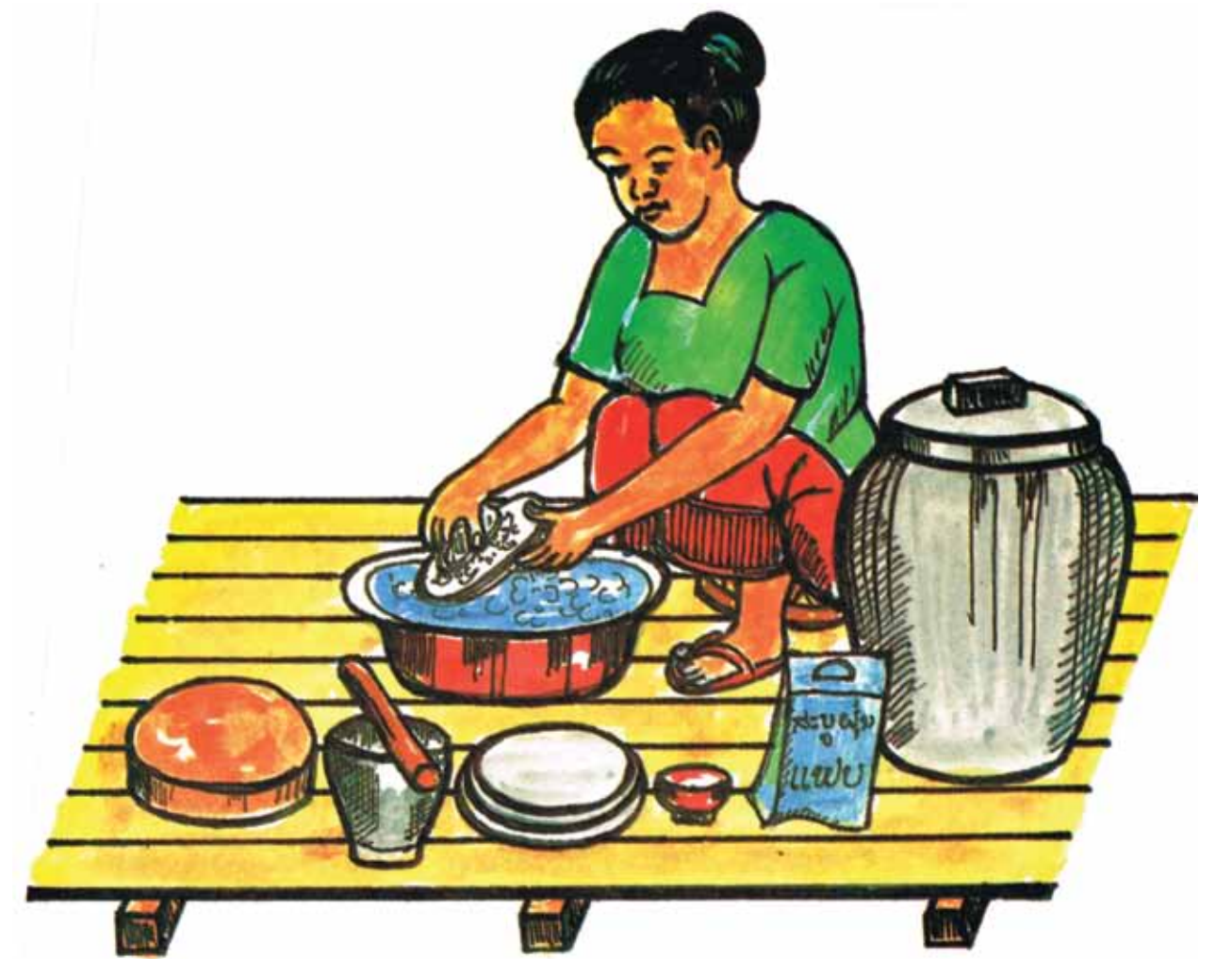
ເຄື່ອງໃຊ້ສຳລັບປຸງແຕ່ງ, ບັນຈຸອາຫານ ຕ້ອງລ້າງດ້ວຍນ້ຳສະອາດ.