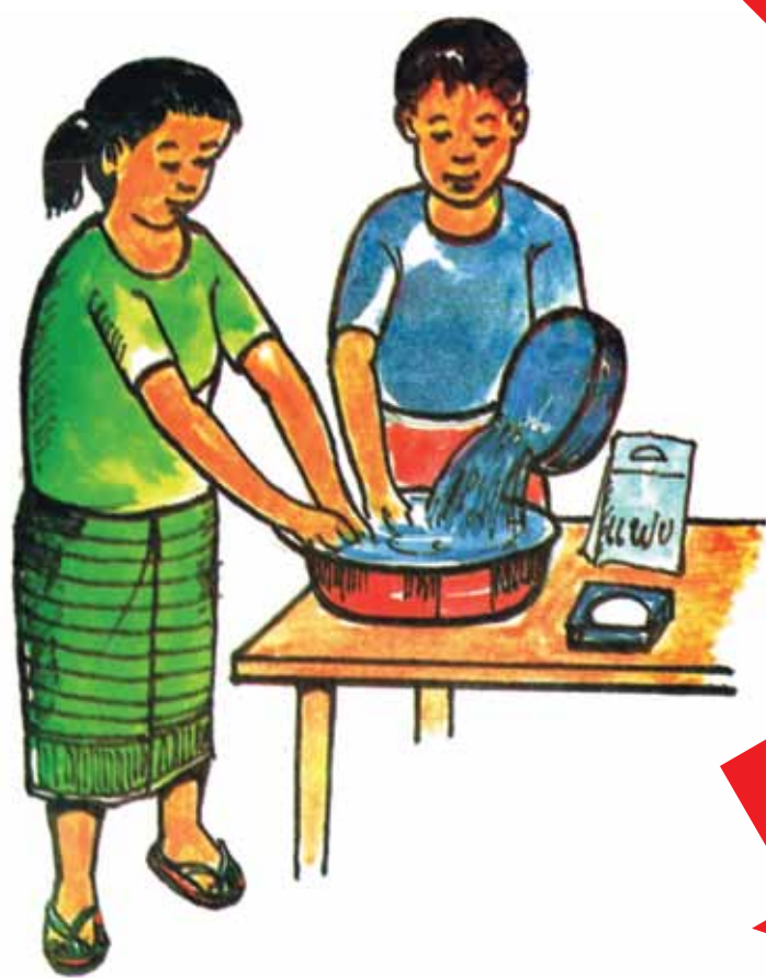
ຄວນລ້າງມືທຸກຄັ້ງກ່ອນກິນເຂົ້າ.