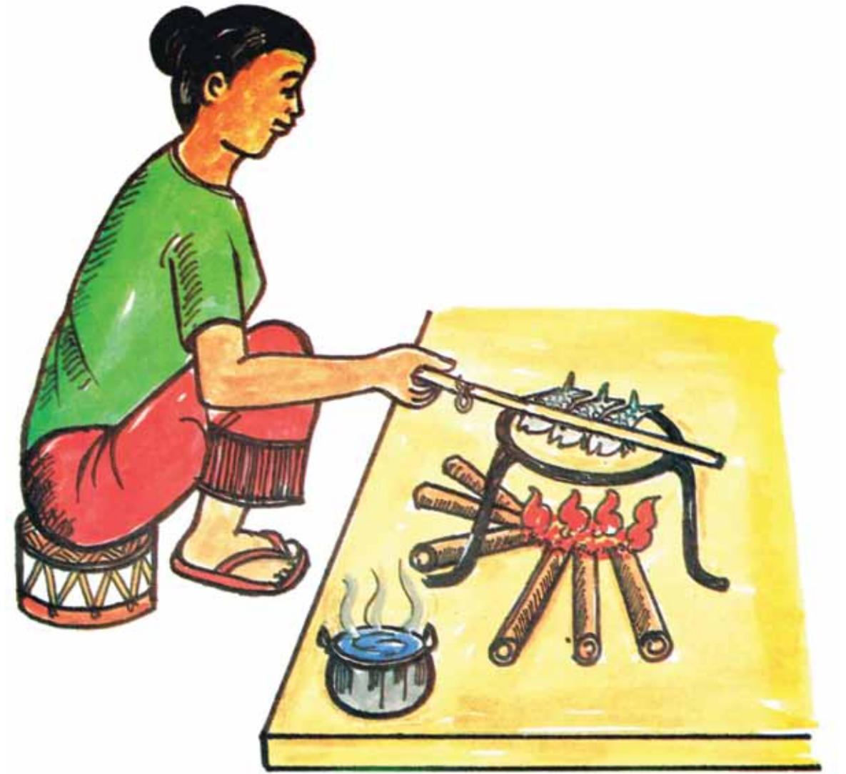
ຄວນປຸງແຕ່ງອາຫານໃຫ້ສຸກດີ ຫລືກເວັ້ນການກິນດິບ.