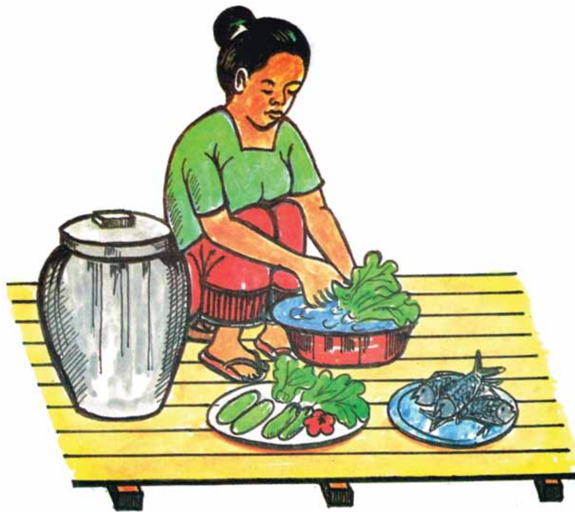
ຜັກຫມາກໄມ້ປາຊື້ນທຸກໆຊະນິດ ຕ້ອງລ້າງໃຫ້ສະອາດກ່ອນຈຳໄປ ປຸງແຕ່ງອາຫານ.