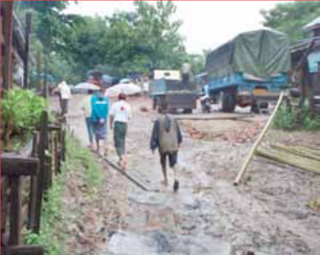
ရပ်ရွာလူထုနှင့်မြန်မာနိုင်ငံကြက်ခြေနီကွင်းဆင်းဝန်ထမ်း များဘေးအန္တရာယ်ကျရောက်မှုရှိသောရွာကိုလိုက်လံစစ်ဆေးနေကြပုံ