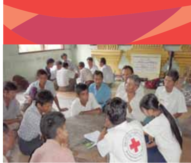
ကျေးရွာအခြေအနေများကိုစစ်ဆေးနိုင်ရန် မြန်မာနိုင်ငံကြက်ခြေနီအသင်းမှဝန်ထမ်းများနှင့်ကျေးရွာလူထုတို့ညှိနှိုင်းဆွေးနွေးတိုင်ပင်နေကြပုံ

ဘေးအန္တရာယ်လျော့ပါးရေးအစီအစဉ်တိုင်းတွင်ဘေးအန္တရာယ်ကျရောက်နိုင်ခြေအရှိဆုံးသော မြို့နယ်များကို ရွေးချယ်ရာ၌ပြည်နယ်နှင့် တိုင်းဒေသကြီးတွင် ဘေးအန္တရာယ်ကျရောက်ရောက်မှုများကိုဖော်ပြထားသောသတင်းအချက်အလက်မှတ်ထမ်းမှတ်ရာများကို ပြန်လည်ကြည့်ရှုစစ်ဆေးခြင်းမှ စတင်ပါသည်။ ဘေးအန္တရာယ်သတင်းအချက်အလက်စစ်ဆေးမှုမှရရှိသောသတင်းအချက်အလက်များနှင့်ဘေးအန္တရာယ်ကျရောက်ခံခဲ့ရသောဖြစ်စဉ်ရှိသည့်သတင်းအချက်အလက်များသည်စီမံချက်အစီအစဉ်များပြုလုပ်မည့်မြို့နယ်ရွေးချယ်ခြင်းလုပ်ငန်းများအတွက် အဓိကအချက်များပင်ဖြစ်သည်။ တစ်ခါတစ်ရံ ပြည်နယ် (သို့) တိုင်းဒေသကြီးများ စကားတင်ရွေးချယ်မှုသည် ကမ်းရိုးတမ်းဒေသများကဲ့သို့ဘေးအန္တရာယ်ကျရောက်ရောက်မှုလျော့ပါးရေးလုပ်ငန်းများနှင့် ပတ်သက်၍မိမိလုပ်ရမည့် တိကျသည့် အစီအစဉ် ရှိနေခြင်းသည် နေရာဒေသရွေးချယ် ရာတွင် ရှင်းလင်းလွယ်ကူစေပါသည်။