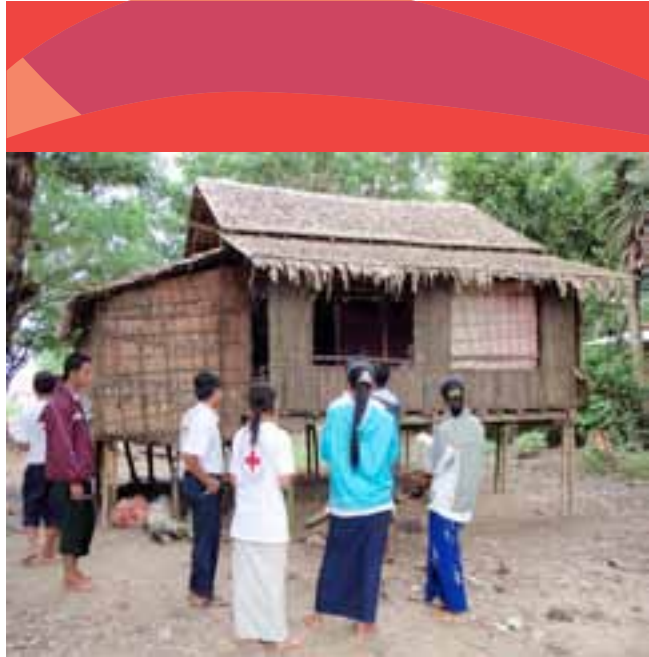
မြန်မာနိုင်ငံကြက်ခြေနီအသင်း ကြက်ခြေနီစေတနာ့လုပ်အားရှင်များ ကနဦးလေ့လာဆန်းစစ်မှုများပြုလုပ်နေပုံ

ချက်များကို ရင်ဆိုင်ဖြေရှင်းရာတွင် မြန်မာနိုင်ငံကြက်ခြေနီအသင်း၏ လုပ်ဆောင်ချက်များသည် အသင်းကြီး၏ ၂၀၁၁ - ၂၀၁၅ မျှော်မှန်းချက်များဖြစ်သော မြန်မာနိုင်ငံတဝှမ်းရှိ ထိခိုက်ခံရလွယ်သောသူများအတွက် ပူးပေါင်းလုပ်ဆောင်ပေးသော ဦးဆောင်လူမှုကဏ္ဍအသင်းအဖွဲ့ ဖြစ်ရန်နှင့် လုပ်ဆောင်ချက်များဖြစ်သော နိုင်ငံတဝှမ်းရှိ စေတနာအကျိုးဆောင်များ ပါဝင်မှုဖြင့် မြန်မာနိုင်ငံကြက်ခြေနီအသင်းသည် ကျန်းမာရေးနှင့် ပြုစုစောင့်ရှောက်ရေးနှင့်ဘေးအန္တရာယ်စီမံခန့်ခွဲရေးတွင် လူမှုကဏ္ဍလုပ်ငန်းတန်းဖိုးနှင့် ရပ်ရွာလူထုပူးပေါင်းပါဝင်မှုကို မြှင့်တင်ခြင်းဖြင့် ထိခိုက်ခံရလွယ်သောသူများ၏ ဘဝကို မြှင့်တင်ရန်ဖြစ်သည်။