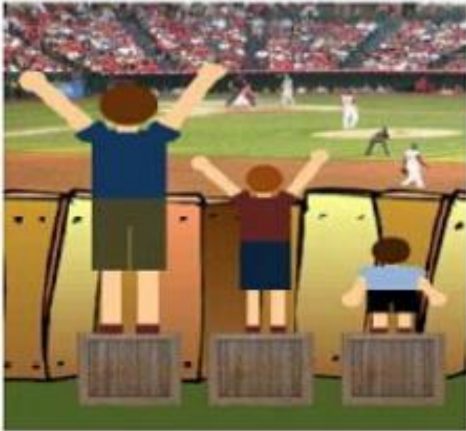
เท่าเทียม