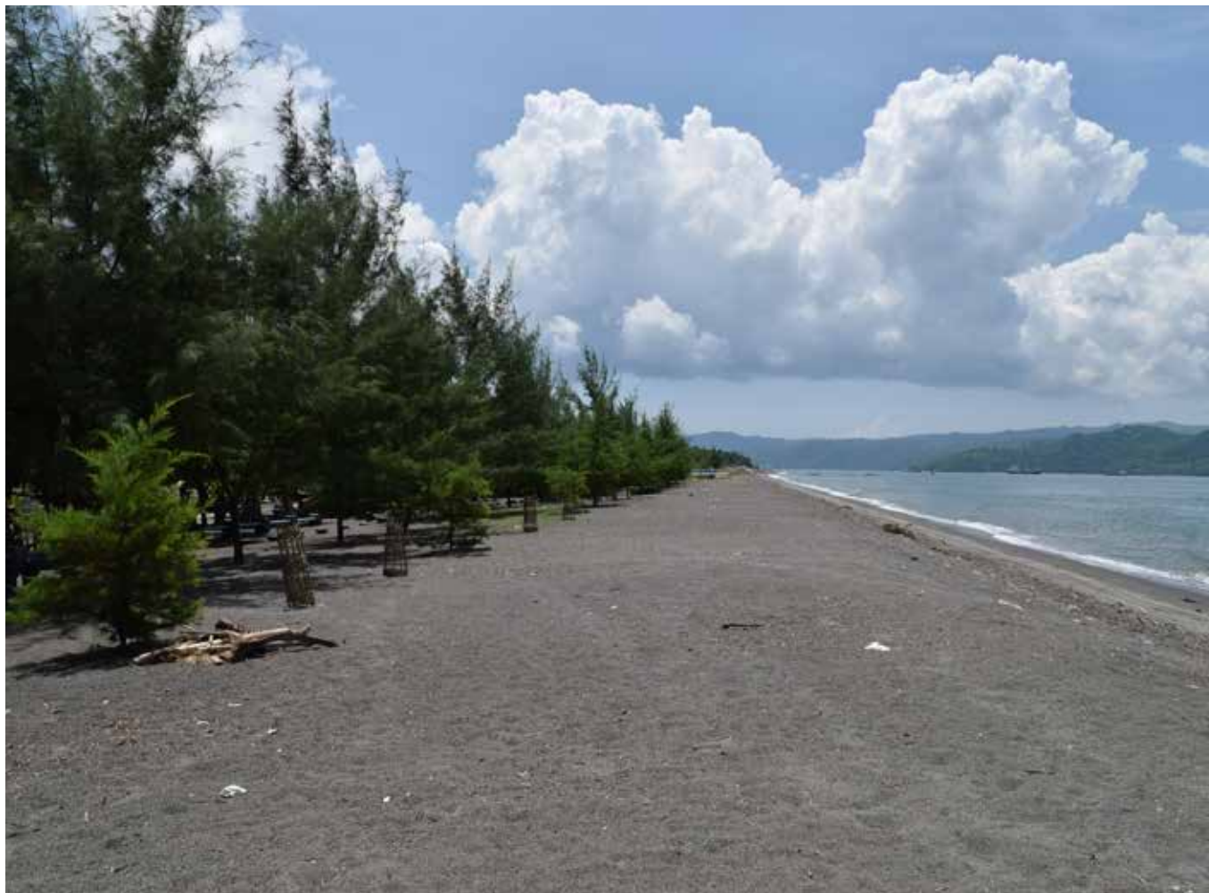
Pepohonan rimbun ini adalah jenis Cemara Laut yang ditanam oleh PMI dan masyarakat pada 2013 silam.

ini kemudian berevolusi menjadi Pengurangan Risiko Terpadu Berbasis Masyarakat (PERTAMA) pada tahun 2006 hingga sekarang. Tahun 2012, dengan dukungan Palang Merah Amerika dan USAID ( United States Agency for International Development ), PMI memulai proyek PERTAMA khusus untuk