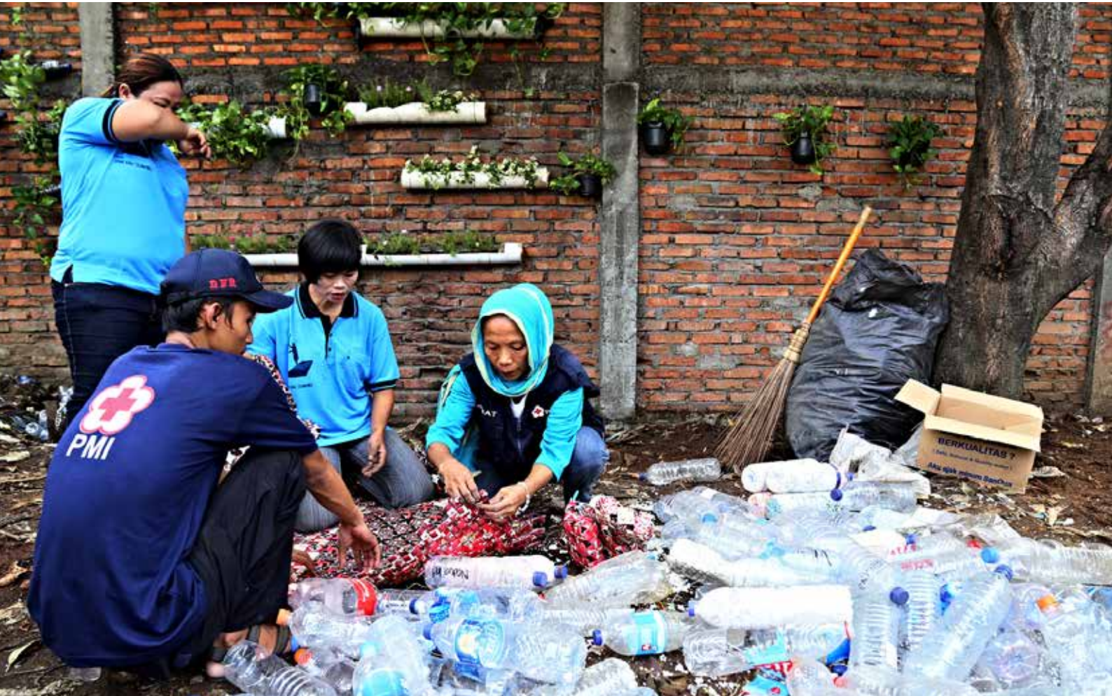
Anggota Tim SIBAT sedang memilah sampah yang akan digunakan sebagai bahan membuat produk seperti tas atau hiasan rumah.