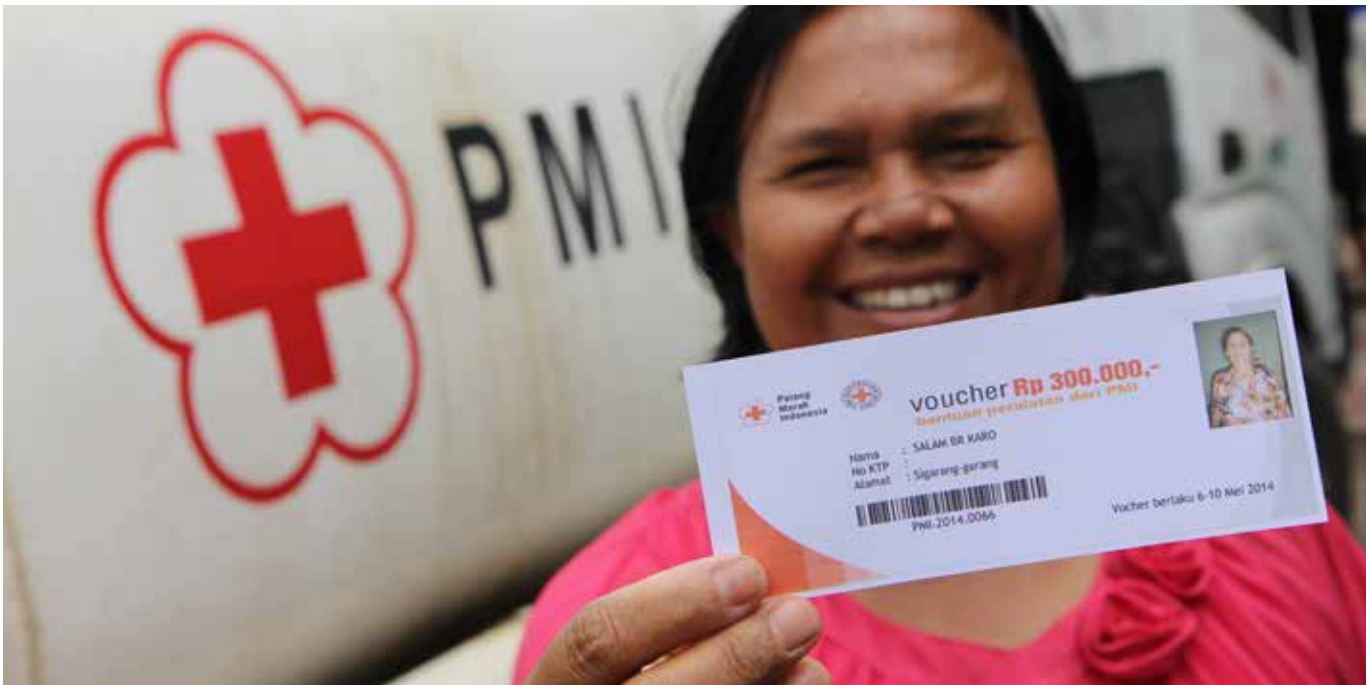
Warga penyintas bencana Gunung Sinabung menerima voucher dari PMI untuk ditukarkan dengan perlengkapan pertukangan.