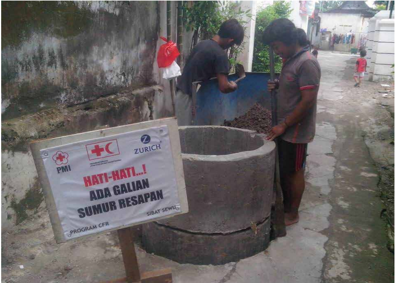
Anggota Tim SIBAT Kelurahan Sewu, Surakarta, sedang menyiapkan ring beton sebagai material pembuatan sumur resapan.