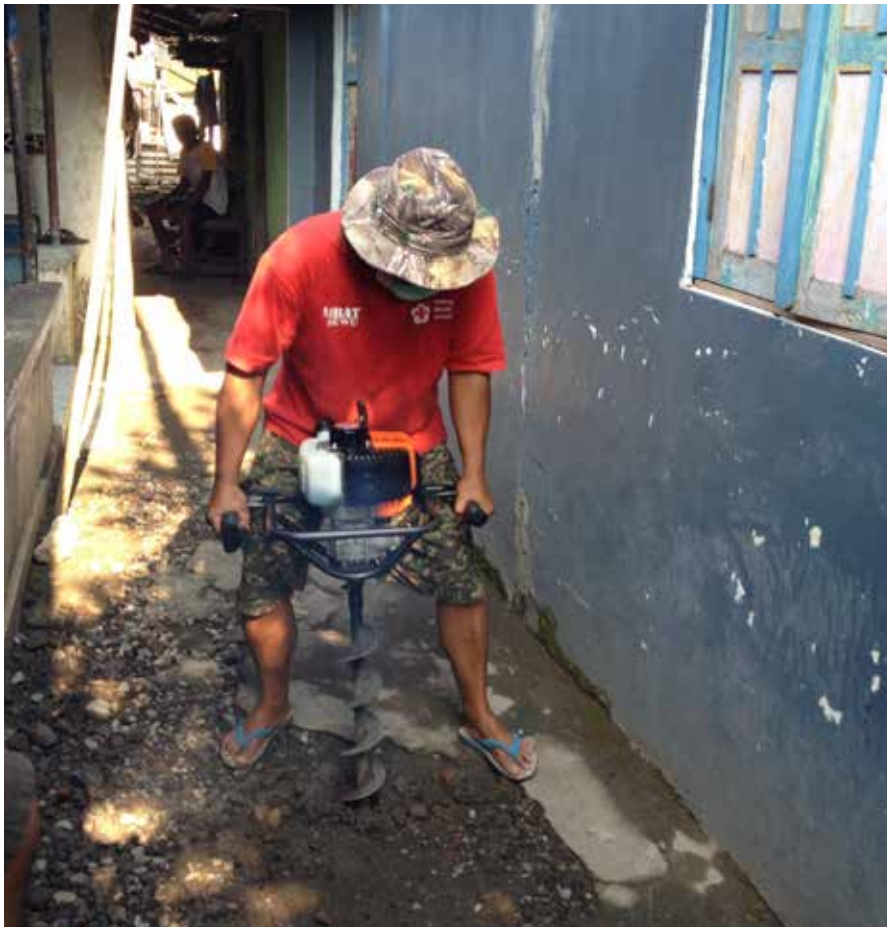
Anggota Tim SIBAT membuat lubang biopori dengan menggunakan mesin bor agar lebih cepat.

Lubang resapan biopori merupakan teknologi tepat guna dan ramah lingkungan untuk mempercepat peresapan air hujan dan mengatasi masalah sampah organik. Lubang resapan ini bermanfaat untuk mencegah banjir, longsor dan erosi, meningkatkan cadangan air bersih serta pembentukan kompos dan penyuburan tanah