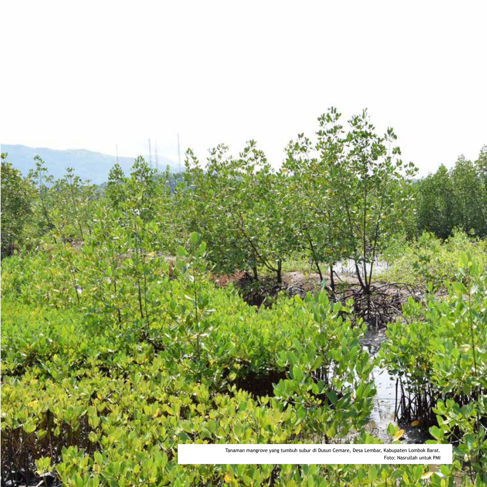
Tanaman mangrove yang tumbuh subur di Dusun Cemare, Desa Lembar, Kabupaten Lombok Barat.