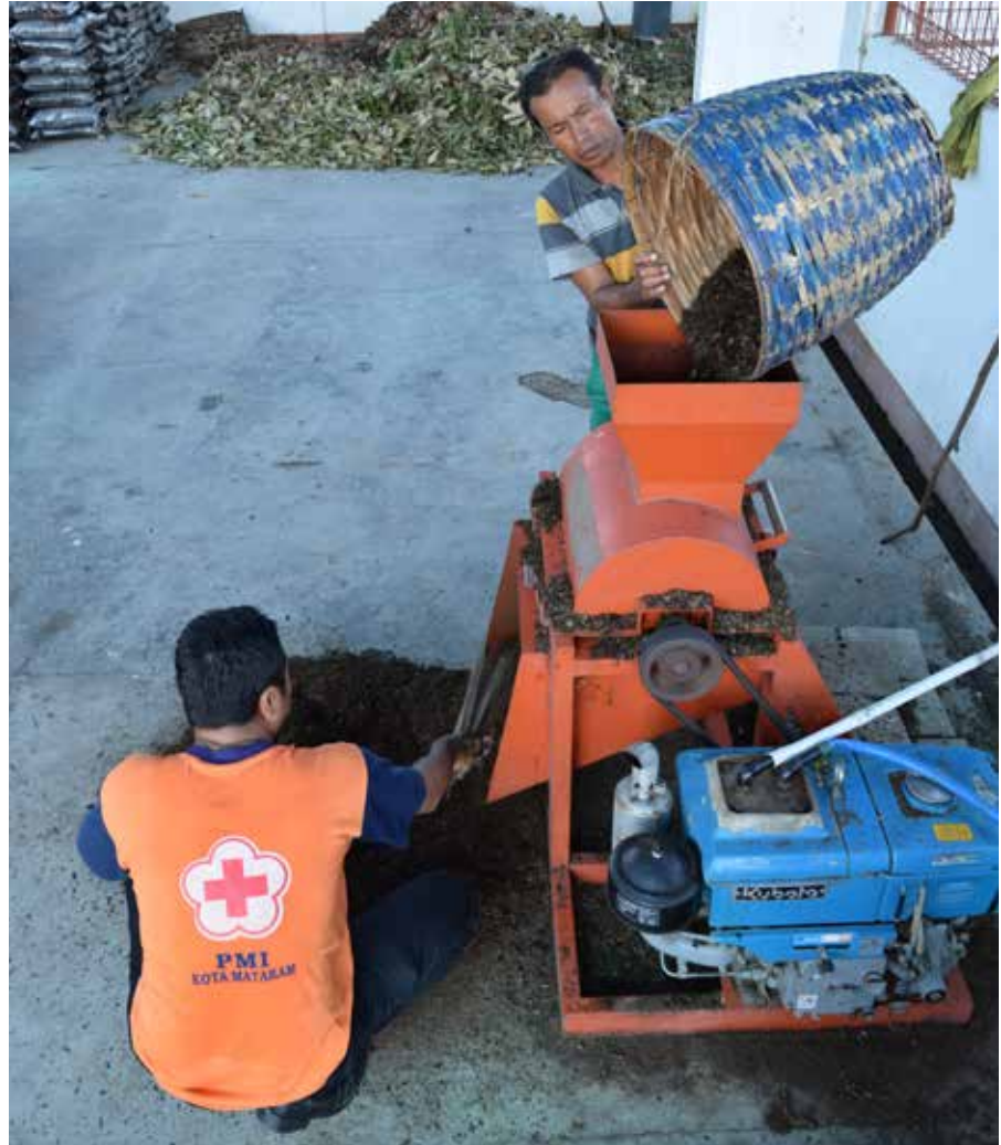
Petugas Unit Pengolahan Sampah Kota Mataram dan Relawan PMI menggunakan mesin cacah untuk menghaluskan sampah daun untuk dijadikan pupuk organik.

Sebagaimana di Ampenan Selatan, program Pengurangan Risiko Bencana dan Adaptasi Perubahan Iklim juga diterapkan di Cibinong, Kabupaten