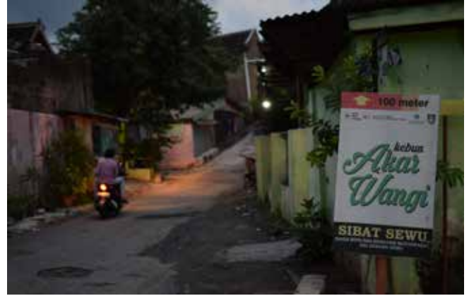
Papan penunjuk arah menuju kebun tanaman Akar Wangi di Kelurahan Sewu, Kota Surakarta.