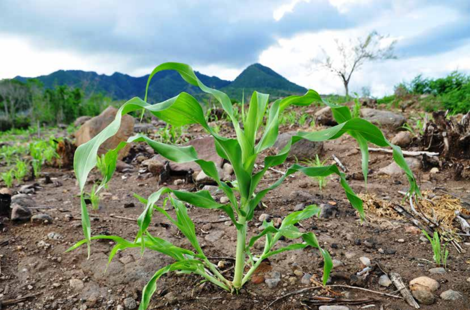
Sorghum usia dua bulan.

tepung sebagai bahan membuat roti dan merah atau kecoklatan terasa lebih pahit. PMI menanam dua jenis ini karena bibit yang tersedia oleh Yayasan Pembangunan Sosial Ekonomi Larantuka (YASPENSEL).