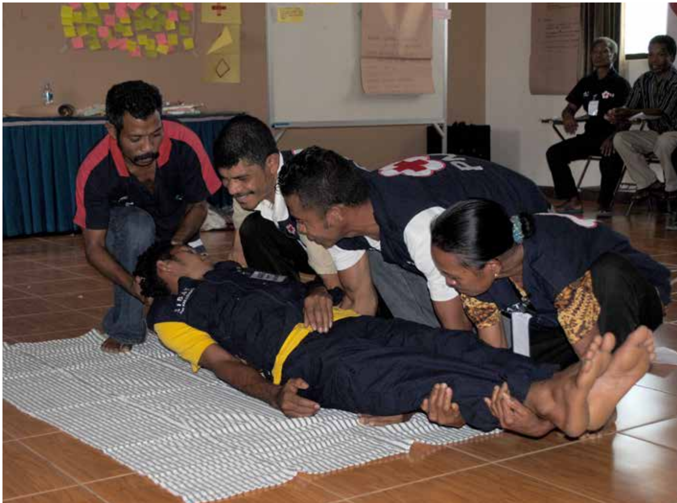
Peserta pelatihan pertolongan pertama sedang mempraktikkan cara mengangkat korban.