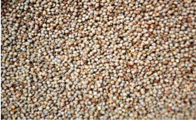
Biji sorgum yang siap diolah menjadi makanan.