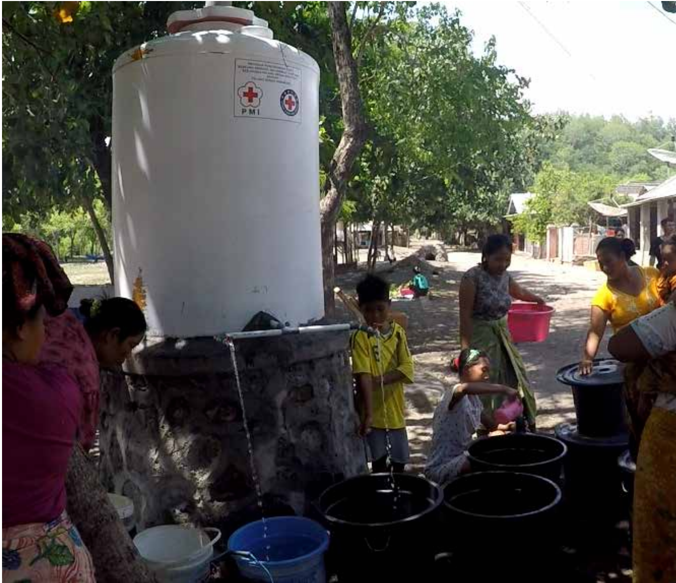
Masyarakat antri mengambil air dari tempat penampungan air yang disediakan oleh PMI.