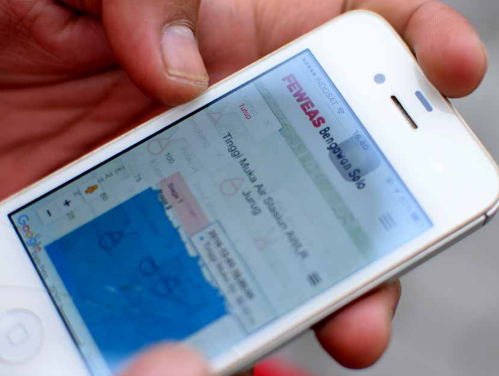
Tampilan aplikasi FEWEAS ketika dibuka di telepon genggam.

di antaranya tentang status siaga banjir, genangan, tinggi muka air, dan prediksi cuaca dalam interval satu jam atau dua jam untuk tiga hari ke depan. Informasi jangka menengah diantaranya prediksi kerentanan banjir dalam interval 10 hari (dasarian) untuk lima tahun ke