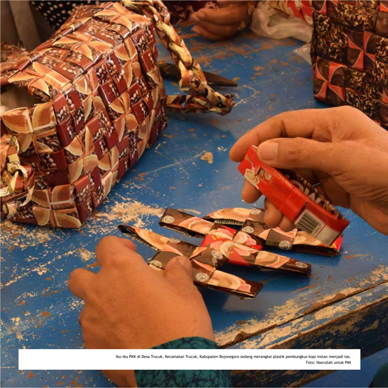
Ibu-ibu PKK di Desa Trucuk, Kecamatan Trucuk, Kabupaten Bojonegoro sedang merangkai plastik pembungkus kopi instan menjadi tas.