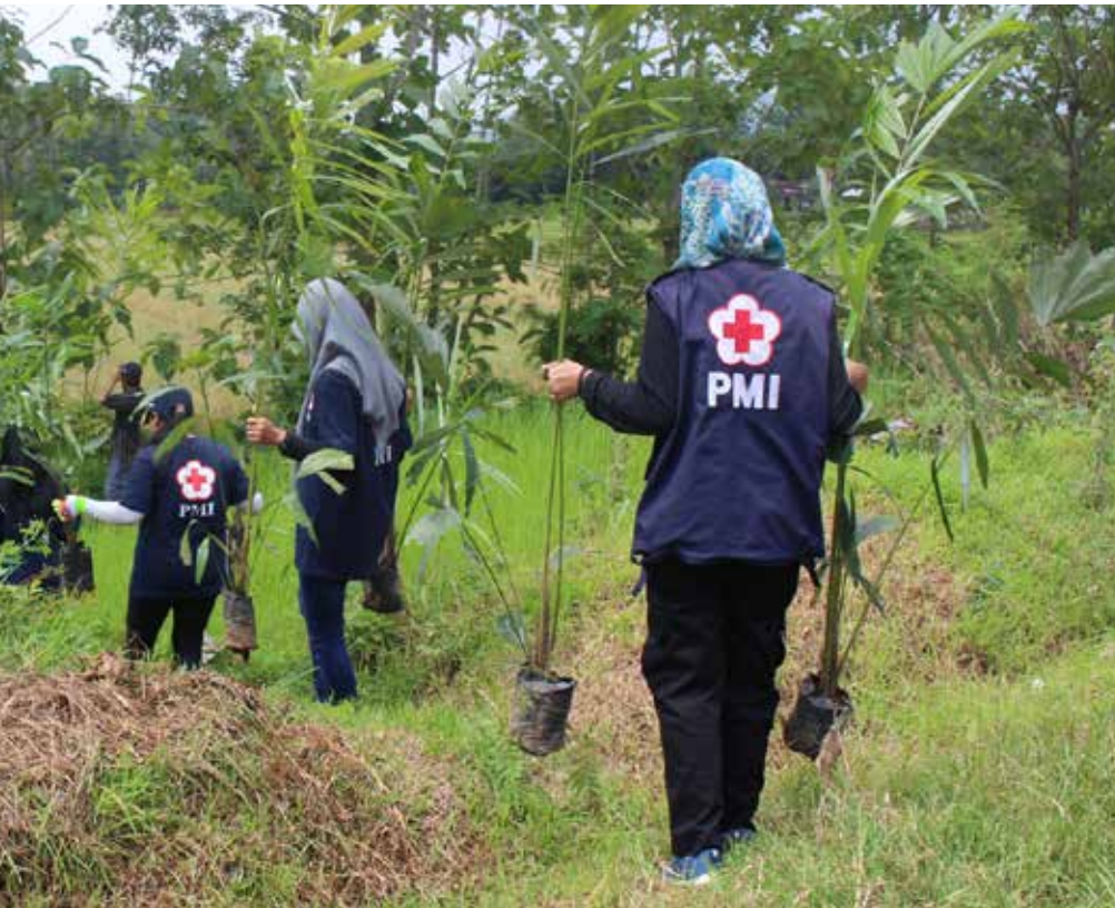
Anggota SIBAT Kabupaten Wonogiri melakukan kegiatan penanaman aren di tepian Sungai Kadu sebagai langkah pencegahan erosi tanah. Sungai ini adalah salah satu sungai yang bermuara di Waduk Gajah Mungkur, yang dianggap sebagai hulu Sungai Bengawan Solo.

Program Masyarakat Tangguh Bencana Banjir ini dilakukan di tiga desa yang mewakili aliran sungai dari hulu ke hilir. Di Wonogiri penanaman dilakukan di Desa Ngadipiro di Kecamatan Nguntoronadi, Desa Gedong di Kecamatan Ngadirojo, dan Desa Gumiwang Lor di Kecamatan Wuryantoro. Setiap desa menanam setidaknya dua ribu bibit pohon aren di bantaran Sungai Kadu yang melewati tiga desa ini. Tanaman yang juga dikenal dengan nama enau ini dipilih