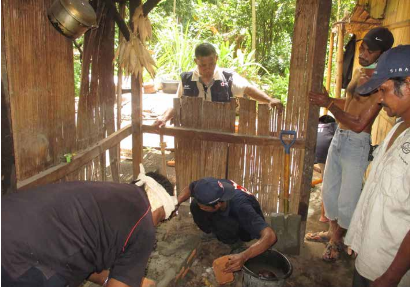
Sebanyak 170 tungku kini telah tersedia untuk 170 keluarga yang kurang mampu di NTT.