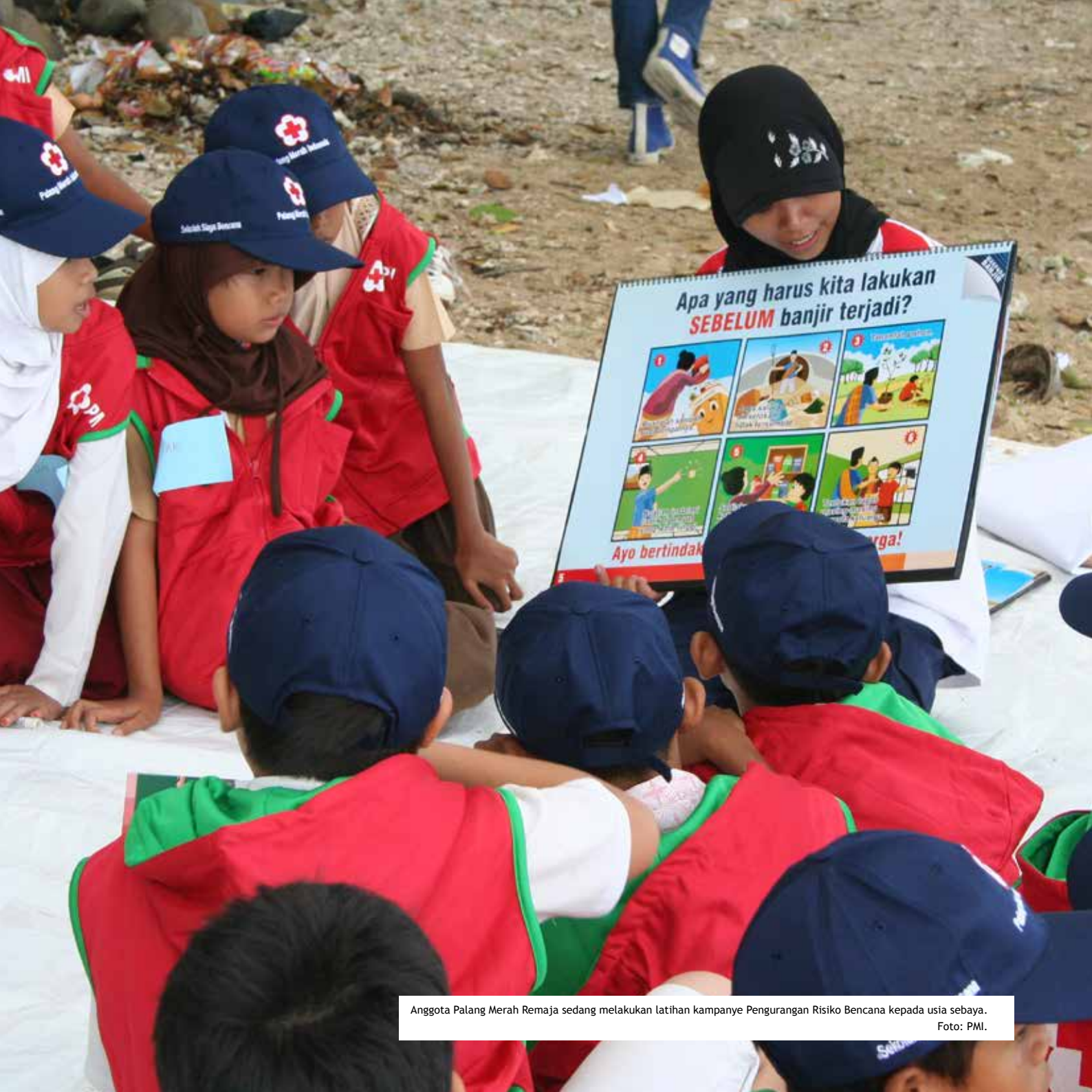
Anggota Palang Merah Remaja sedang melakukan latihan kampanye Pengurangan Risiko Bencana kepada usia sebaya.