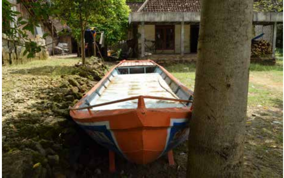
Perahu evakuasi yang siap digunakan jika terjadi banjir.

Ketiga desa ini memiliki cara penyimpanan perahu yang berbeda. Di Sumbangtimun misalnya, perahu ditempatkan secara terpisah, menyesuaikan kebutuhan. “Satu perahu di RT 16 karena paling rendah dan paling pertama air meluap,” terang Abdul Halim. “Satu lagi di RT 1,” tambahnya. RT 16 ada kali (kanal) yang terhubung dengan Sungai Bengawan Solo sehingga aliran air masuk melalui kanal tersebut. Sedangkan di Tulungrejo, kedua perahu ditambatkan di Balai Desa, yang juga berfungsi sebagai POSKO SIBAT. Hal