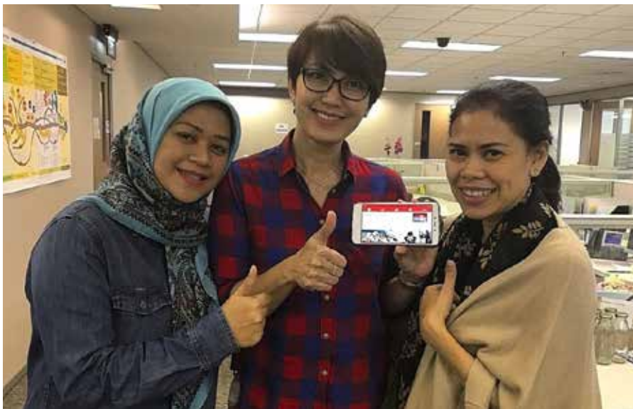
Karyawan sebuah kantor swasta menunjukkan aplikasi First Aid dari telepon genggam mereka.

“Aplikasinya bagus, user friendly , informasinya membantu banget, terutama untuk orang-orang yang nggak punya background kesehatan,” katanya. “Bahasa di aplikasinya gampang dimengerti dan bahkan saking merasa itu berguna banget, aku share ke teman-teman di kantor pada saat ada sesi safety moment sharing ,” tambah perempuan yang sudah sembilan tahun menjadi praktisi HR ini. Namun, ia menilai meskipun sudah sangat membantu, ia berharap aplikasi ini bisa dilengkapi dengan informasi nomor darurat sehingga setelah mendapatkan atau memberikan pertolongan pertama, korban dapat segera mendapatkan pertolongan lebih lanjut. Sejak diluncurkan pada November 2014 lalu, aplikasi ini setidaknya sudah 10 ribu