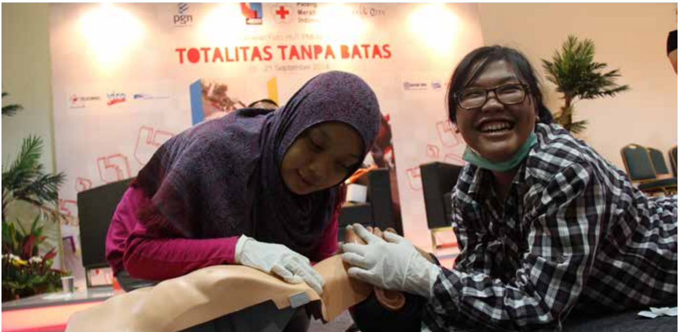
Peserta pelatihan pertolongan pertama sedang mempraktikkan pembekalan teori yang sudah didapatkan sebelumnya.