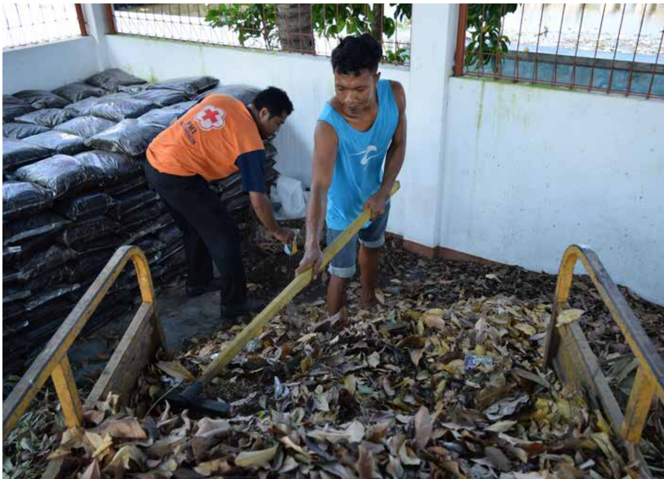
Petugas Dinas Kebersihan Kota Mataram dan relawan PMI memilah sampah untuk didaur ulang menjadi pupuk organik.