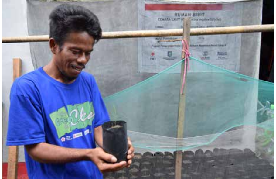
Salah satu warga Dusun Cemare menunjukkan bibit cemara laut hasil pembibitan di halaman rumahnya.

Di wilayah Lombok Barat, kerusakan ekosistem mangrove diawali oleh pengambilan kayu untuk kayu bakar yang diikuti pembukaan lahan hutan untuk dijadikan usaha tambak udang