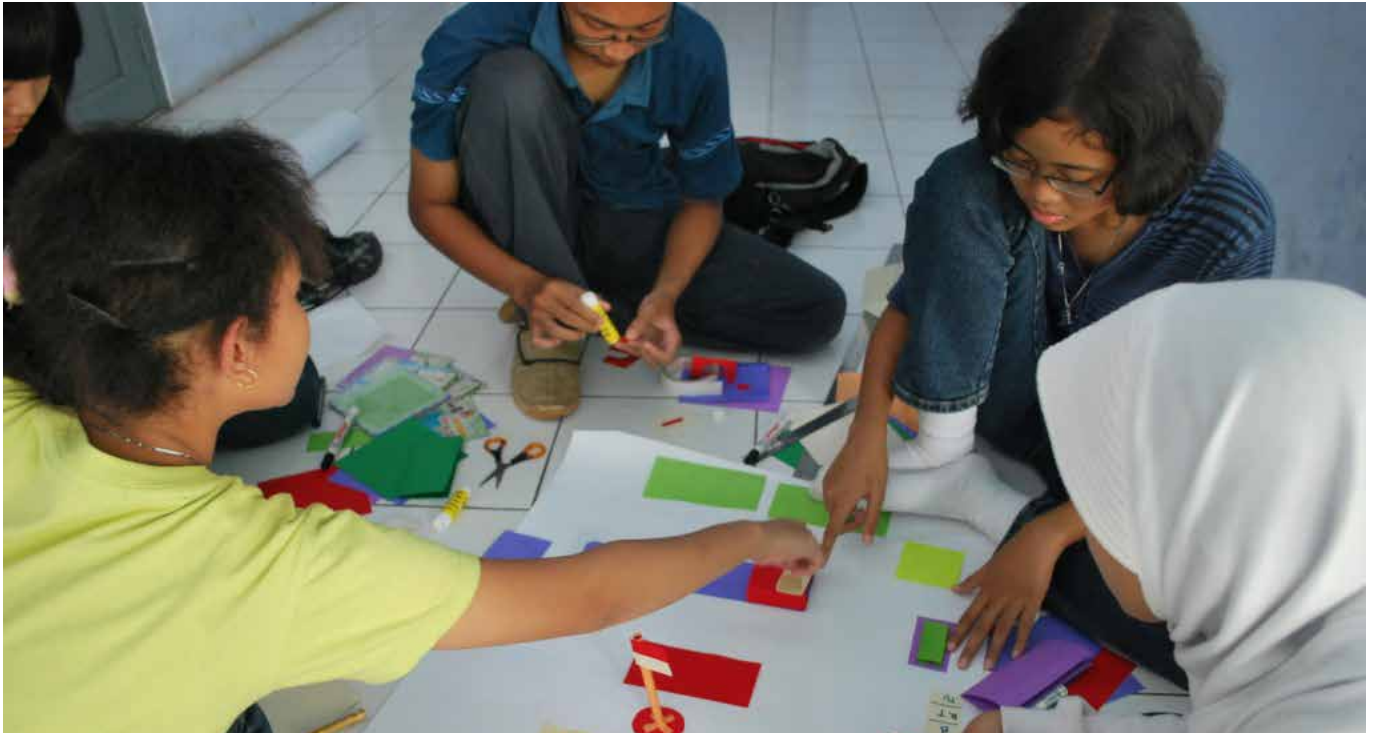
Siswa belajar membuat peta lingkungan sekolah untuk mengetahui letak jalur evakuasi.