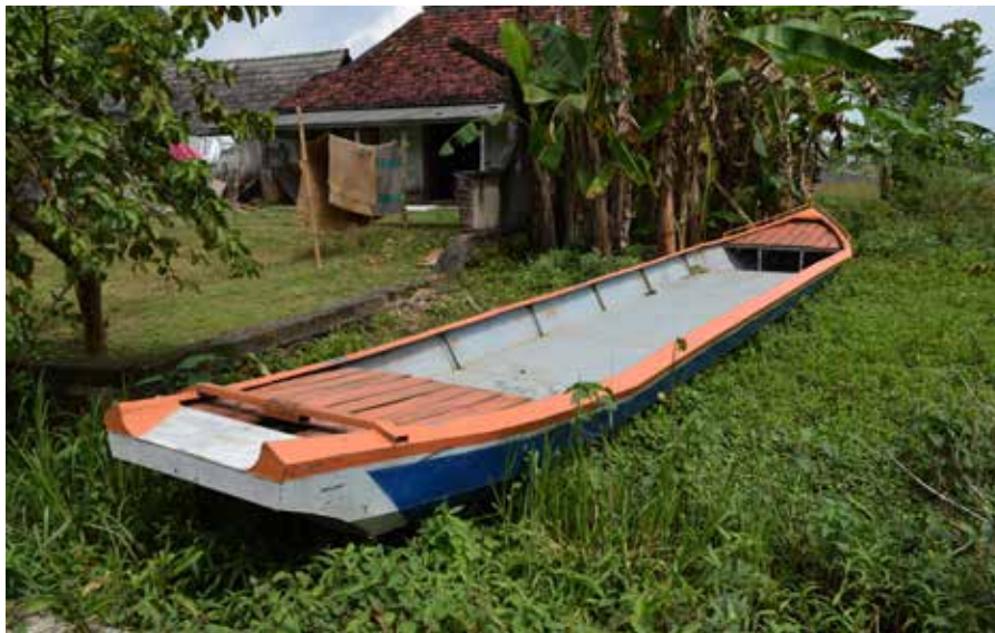
Penempatan perahu berdasarkan kesepakatan warga untuk ditambatkan di titik-titik paling rawan banjir.