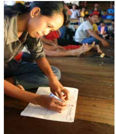
Salah satu TKI mengisi formulir berita keluarga untuk dikirimkan ke anggota keluarganya melalui PMI.