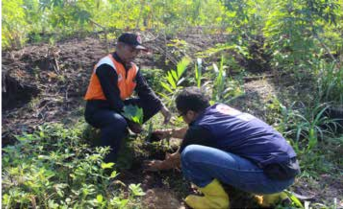
Anggota Tim SIBAT bersama-sama dengan masyarakat menanam bibit pohon aren di bantaran Sungai Kaduang, Kabupaten Bojonegoro. Sungai Kaduang adalah hulu Sungai Bengawan Solo.