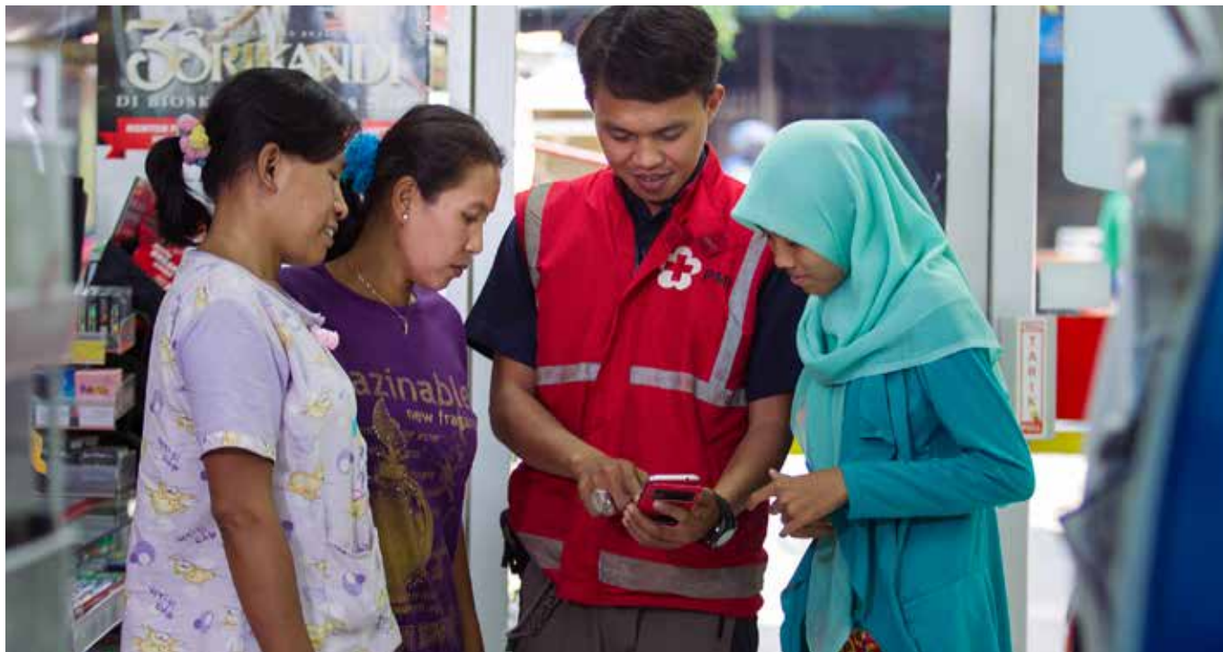
Relawan PMI mengajarkan proses dan cara kerja transfer bantuan berbasis tunai melalui telepon genggam.