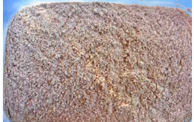
Sorghum ditumbuk jadi bubuk.

inovasi, pertumbuhan, dan penciptaan lapangan kerja. Tindakan tersebut termasuk mendorong efisiensi biaya dan infrastruktur untuk menyelamatkan hidup, mencegah dan mengurangi kehilangan dan memastikan pemulihan dan rehabilitasi yang lebih efektif.