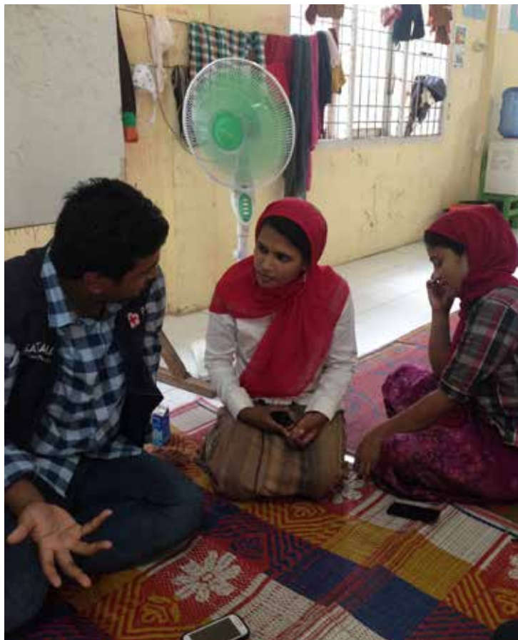
Tim dari PMI melakukan pendampingan kepada TKI.

Melihat besarnya harapan terhadap keberadaan PMI dalam operasi ini, muncul usulan untuk mendirikan kantor cabang PMI di kabupaten yang baru resmi menjadi wilayah administratif sendiri pada tahun 1999. "Persiapannya dari akhir tahun 2002 hingga 2004," ujar Ashar. Sebuah keputusan tepat mengingat tiga tahun berselang sejak pemulangan besar-besaran pada tahun 2002 tersebut, Kabupaten Nunukan kembali menghadapi situasi yang sama ketika ribuan puluhan ribu TKI tiba di Nunukan pada tahun 2005.