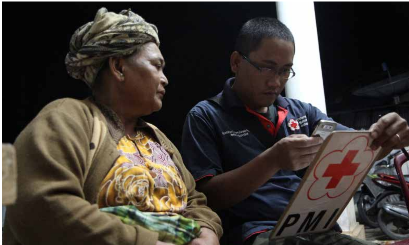
Relawan PMI melakukan verifikasi data penerima manfaat.