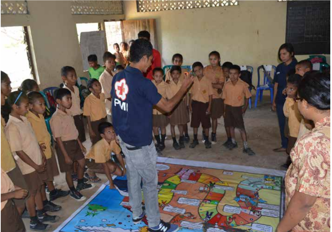
Fasilitator PMI mengajarkan cara bermain Ular Tangga di salah satu sekolah di Nusa Tenggara Timur.