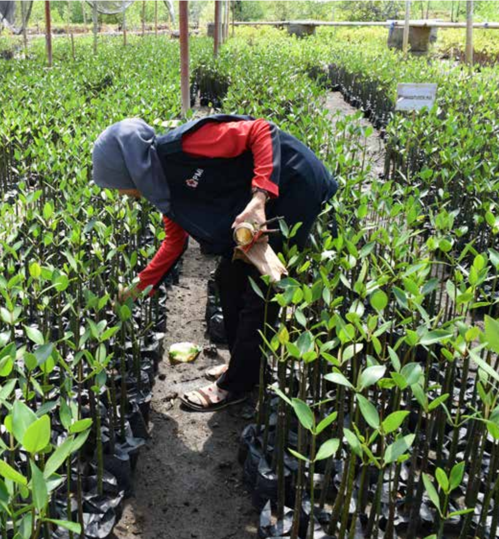
Salah seorang sukarelawan PMI Kabupaten Lombok Barat melakukan kegiatan pemeliharaan di salah satu lokasi pembibitan mangrove di Dusun Cemare.