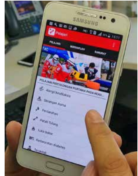
Aplikasi First Aid yang bisa diunduh di telepon genggam dengan sistem operasi Android atau iOS.

Mengikuti tren di masyarakat yang menggunakan aplikasi dalam beberapa kebutuhan dalam kehidupan sehari-hari, PMI lalu mengembangkan aplikasi pertolongan pertama yang disebut PMI First Aid. Aplikasi yang dapat diunduh secara gratis di telepon pintar berbasis android atau iOS ini, berisi informasi pertolongan pertama untuk kondisi seperti alergi, asma, perdarahan, patah tulang, luka bakar, kedaruratan diabetes, tersedak, panik histeria, serangan jantung, sengatan panas, cedera kepala, hipotermia, keracunan, kejang epilepsi, syok, meningitis, sengatan gigitan, nyeri otot keseleo, stroke, demam berdarah, influenza, diare akut, tidak sadarkan diri dan bernafas, dan tidak sadarkan diri dan tidak bernapas.