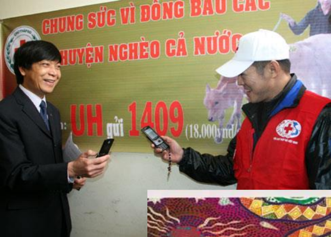
Movie Star Jet Li