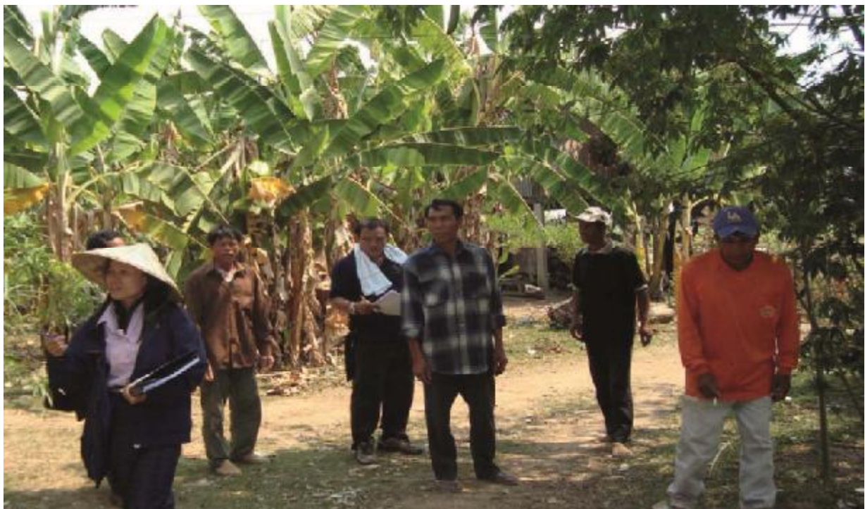
ການສັງເກດໂດຍກົງເປັນສິ່ງທີ່ຈຳເປັນ, ການເສື່ອມສານເຂົ້າໃນການປະເມີນຄວາມອ່ອນແອ ແລະຄວາມສາມາດ, ອີງການກາແຕງລາວ

ທິມງານຂອງທ່ານ ໄດ້ກຳນົດແຜນທີ່ສະບັບທຳອິດແລ້ວ. ຕໍ່ໄປແມ່ນຕ້ອງການຂໍ້ມູນ ຈາກບຸກຄົນສຳຄັນທີ່ເປັນຜູ້ໃຫ້ຂໍ້ມູນ ເພື່ອກຳນົດ ເຂົ້າໃນແຜນທີ່ ແລະ ສະເໜີໃຫ້ເຂົາເຈົ້າ ສະໜອງຂໍ້ມູນທີ່ກ່ຽວຂ້ອງ ເພື່ອໃຫ້ຂໍ້ມູນມີຄຸນນະພາບ ທີ່ປະກົດຢູ່ໃນແຜນທີ່. ຕ້ອງໃຫ້ແນ່ໃຈວ່າບຸກຄົນສຳຄັນຜູ້ທີ່ໃຫ້ຂໍ້ມູນເຂົ້າໃຈວ່າແຜນທີ່ສະບັບສຸດທ້າຍ ພ້ອມທັງຂໍ້ມູນໃໝ່ ທີ່ໄດ້ຈາກພວກເຂົາເຈົ້າຈະໄດ້ນຳສະເໜີ ໃນຂະນະທີ່ປະຊຸມຮ່ວມກັບຊຸມຊົນ, ຊຶ່ງຈະໄດ້ຈັດຂຶ້ນໃນສາມມື້ຕໍ່ໜ້າໜ້າ.