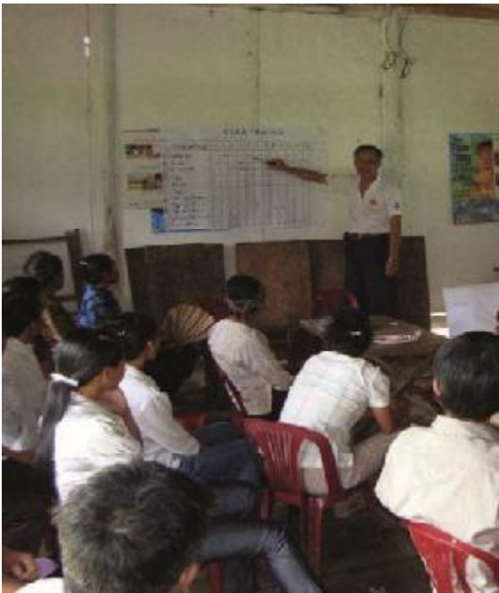
ຄົນໃນຊຸມຊົນຄວນຈະມີສ່ວນຮ່ວມໃນຂະບວນການທັງໝົດ-ກາແດງຫວຽດນາມ

ຈົ່ງຈຳແລ້ວວ່າ ສະມາຊິກຊຸມຊົນ ເປັນຜູ້ທີ່ຮັບປະກັນການເຮັດວຽກ ສ່ວນຮ່ວມ ສາລີ ບໍ່ ຖ້າສາມາດສອບເສັງ ຕັດສິນໃຈ ເລີຍຮ່ວມ, ພວກເຂົາເຈົ້າກໍຈະສາມາດຊ່ວຍຫຼືມາຊ່ວຍ ໃນການເກັບກຳຂໍ້ມູນ ສວກເຂົາສູ້ຜົວວ່າ ທີ່ມາຊ່ວຍເຮົາກັບໃຜ ສູ້ເວລາທີ່ຈະພົບຜູ້ທີ່ເຂົາເຈົ້າພົບ ຢູ່ບ່ອນໃດ.