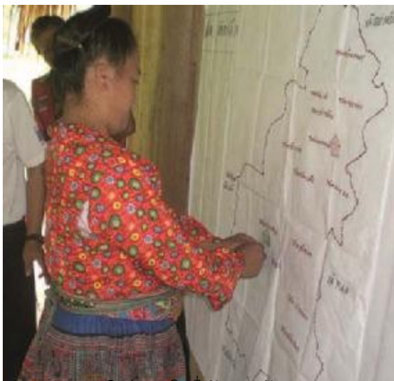
ການມີສ່ວນຮ່ວມຂອງຊົນເຜົ່າຄວນໄດ້ຜິດຈາລະນາເອົາໃຈໃສ່, ກາແດງຫວຽດນາມ