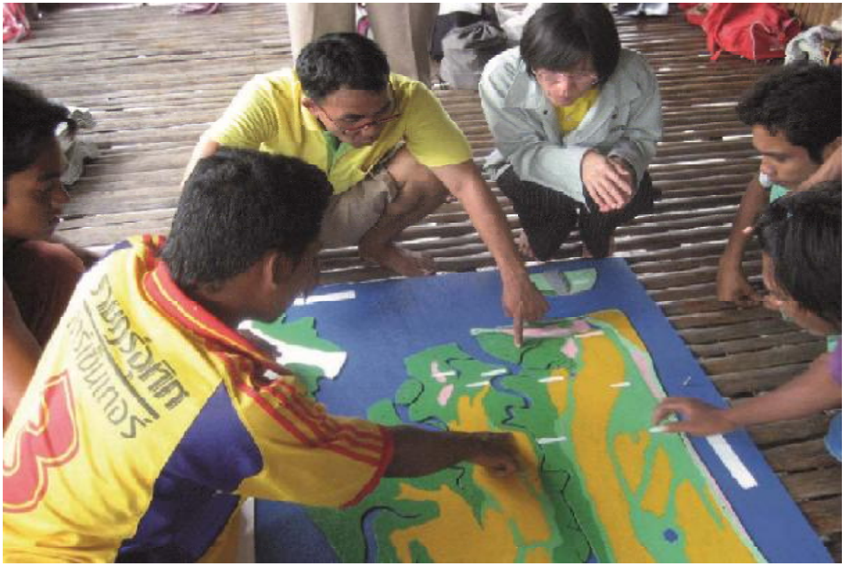
ການວິເຄາະຄວາມສ່ຽງໂດຍຜ່ານການສ້າງແຜນທີ່, ກາແດງໄທ