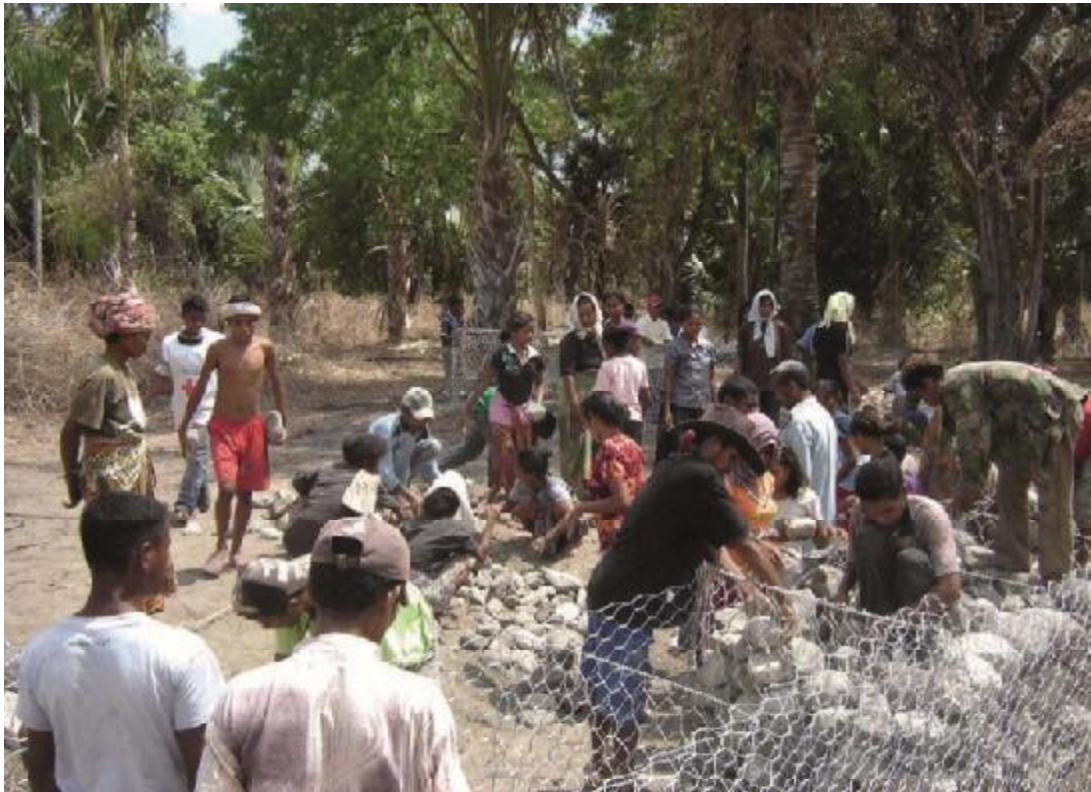
ອາສາສະໝັກກາແດງຊ່ວຍຊຸມຊົນ ໃນການໃຊ້ທຶນກຳກັນຕະລົງເຈື່ອນ - ກາແດງຕີມິຕາເວັນອອກ