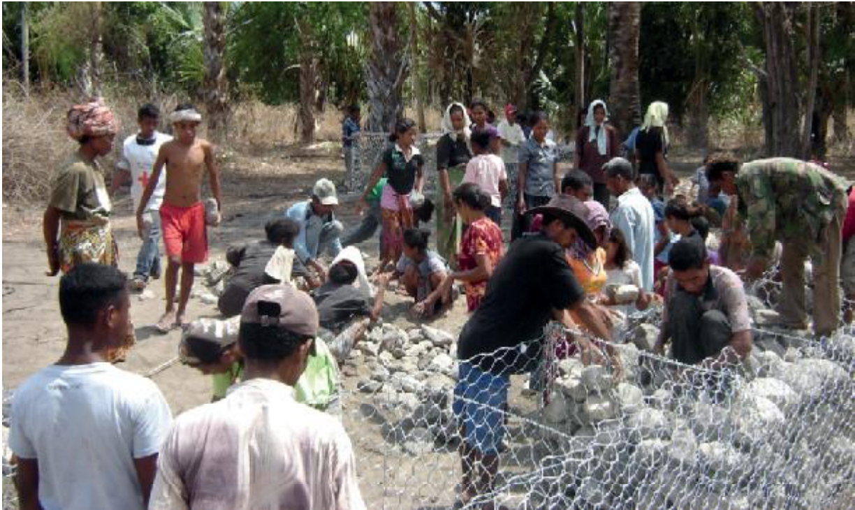
អ្នកស្ម័គ្រចិត្តកាកបាទក្រហមជួយសហគមន៍កសាង “ សត្វនាគដុំថ្ម ” ដើម្បីការពារជ្រាំដទន្ទេពីសំណឹក បទពិសោធន៍កាកបាទក្រហមទីម័រខាងកើត