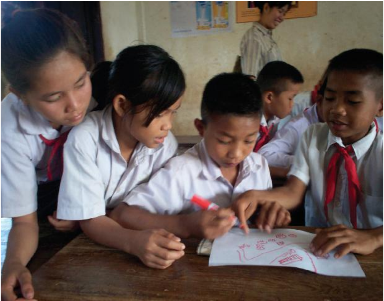
កុមារគួរតែជាផ្នែកមួយនៃដំណើរការបំប្លែងប្រមាណភាពងាយរងគ្រោះ និងសមត្ថភាព-- បទពិសោធន៍ កាកបាទក្រហមឡាវ

ធានាថា មនុស្សសំខាន់ៗទាំងនោះយល់ថា សេចក្តីព្រាងចុងក្រោយនៃតារាងដែលមានបញ្ចូលព័ត៌មានថ្មីៗ ពីពួកគេនឹងត្រូវបង្ហាញជូនក្នុងពេលប្រជុំសហគមន៍ ដែលនឹងធ្វើឡើងនៅថ្ងៃទី ៣ បន្ទាប់ទៀត ។