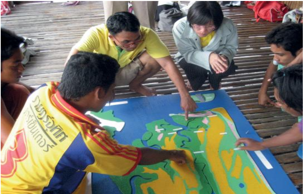
ការវិភាគហានិភ័យ តាមរយៈផែនទី - កាកបាទក្រហមថៃ