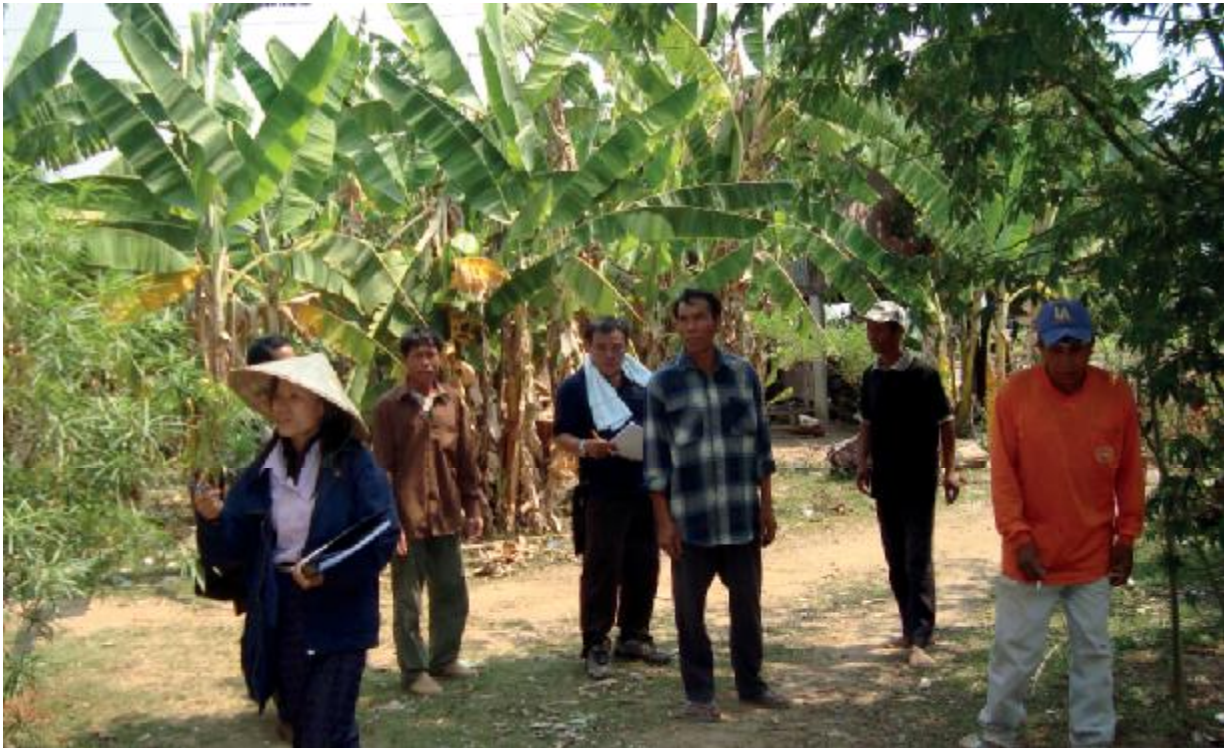
ការអង្កេតផ្ទាល់គឺសំខាន់ណាស់ និងចូលរួមគ្រប់ផ្នែកទាំងអស់នៃវគ្គបណ្តុះបណ្តាលការប៉ាន់ប្រមាណភាពងាយរងគ្រោះ និង សមត្ថភាព បទពិសោធន៍កាកបាទក្រហមឡាវ