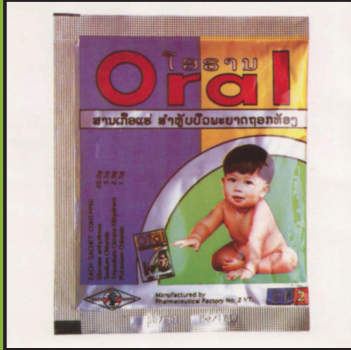
ຂອງລາວຊະນິດໃຫ່ມ

ຝຸ່ນໂອລາລິດຂອງລາວ ຊະນິດໃຫ່ມ ແລະ ຊະນິດເກົ່າ