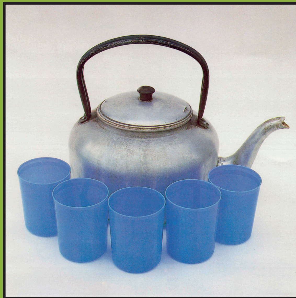
ນໍ້າ 5 ຈອກເຕັມ ( ນໍ້າຕົ້ມປະເຢັນ )