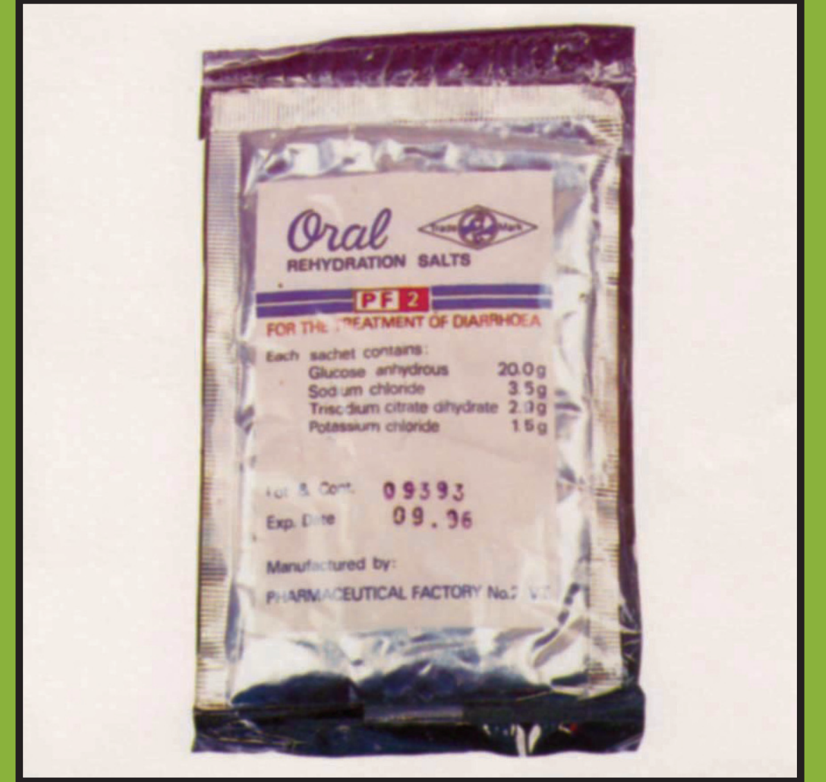
ຂອງລາວຊະນິດເກົ່າ