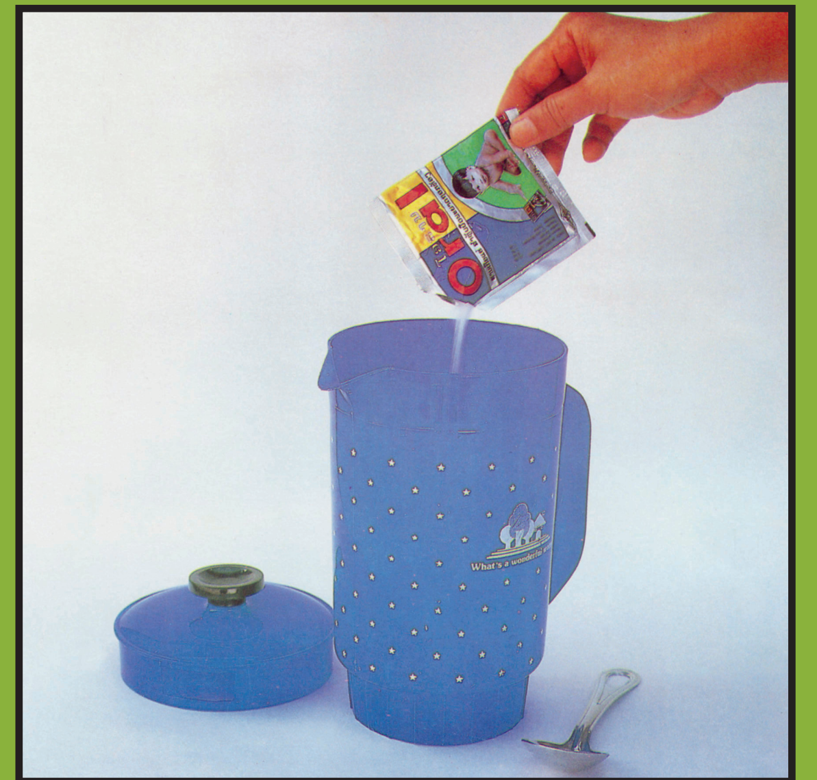
ເທຝຸ່ນ ໂອລາລິດ 1 ຊອງ ລົງໃສ່ໂຕ