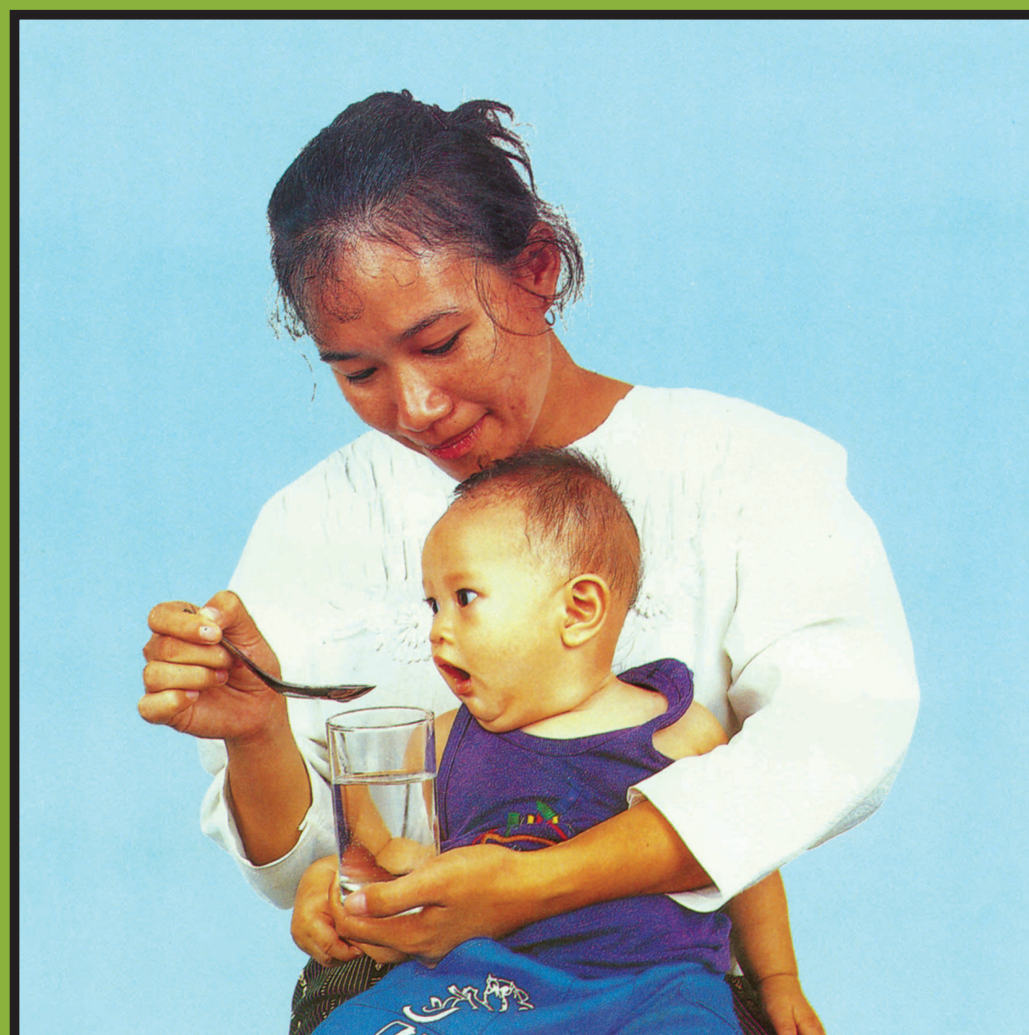
ເດັກອ່ອນປ້ອນດ້ວຍບ່ວງເທື່ອລະນ້ອຍ ( ໃຫ້ 1/2 ຈອກຢາງ = 100 cc )