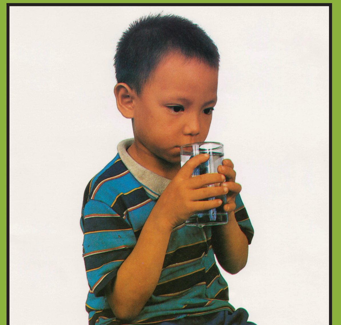
ເດັກໃຫ່ຍກິນໃສ່ຈອກກໍໄດ້ ( ໃຫ້ 1 ຈອກຢາງ = 200 cc )