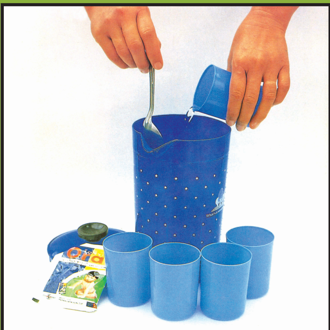
ຖອກນໍ້າ 5 ຈອກເທົ່າທຽມກັບນໍ້າ 1 ລິດ ລົງໃສ່ ແລ້ວຄົນໃຫ້ລະລາຍດີ